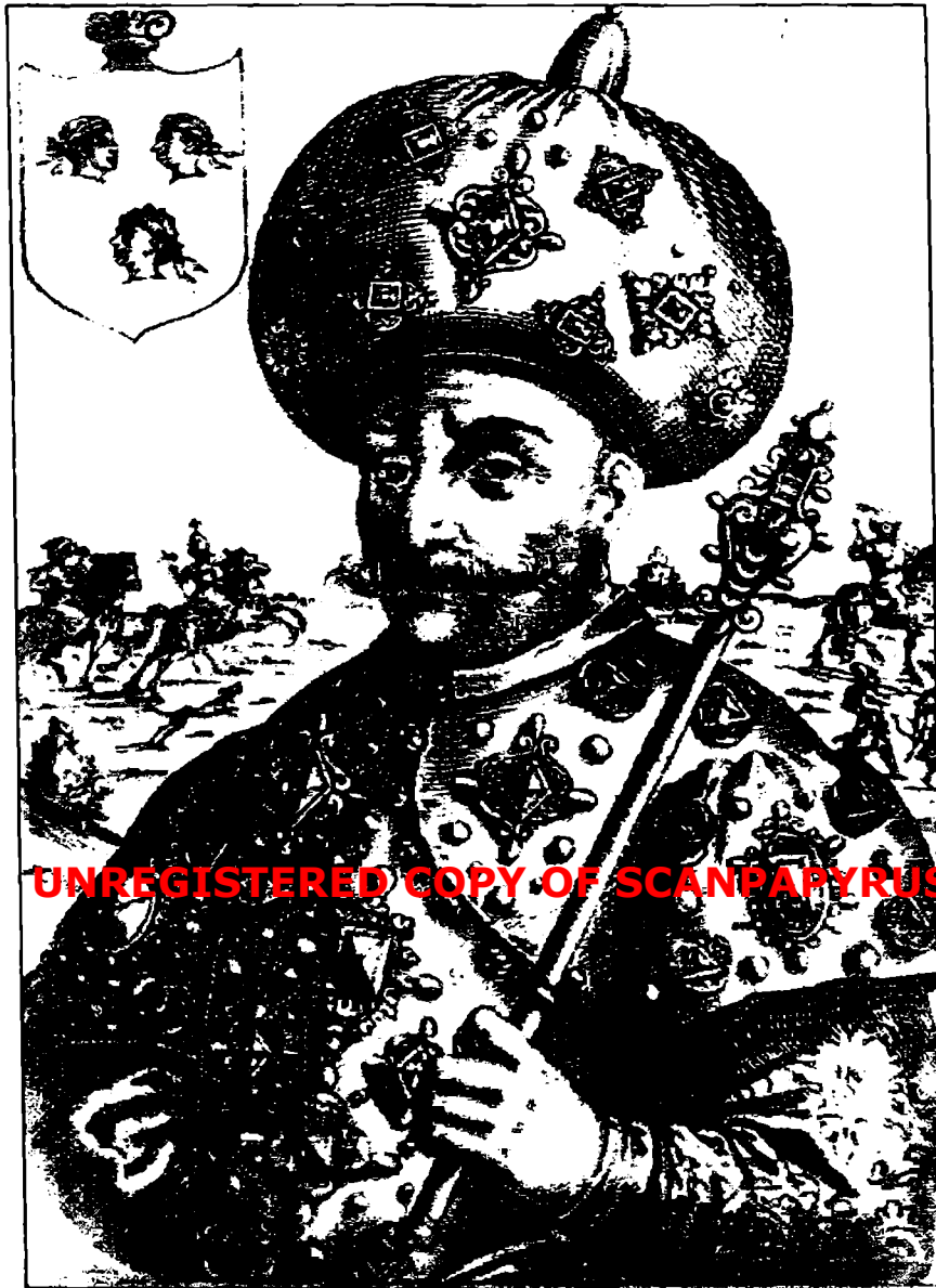
Гази Герай II (1554–1607). Европейская гравюра 1593 года.